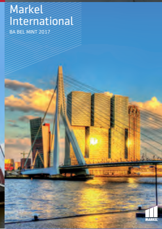
Markel International BA BEL MINT 2017